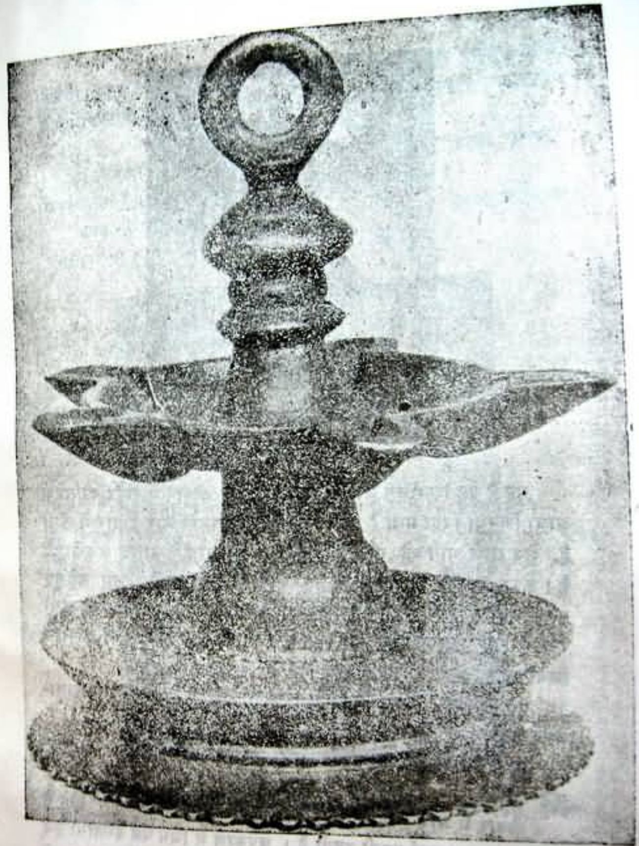
अष्टधातु का दीप

"अलाउद्दीन और उसका मायावी (जादुई) दीप" शीर्षक की कथा यद्यपि इस्लामी मानी जाती है परन्तु वह वास्तव में इस्लामपूर्व समय की है जब अरबों के देवमन्दिरों में दीप जलाए जाते थे। वह ज्योति ईश्वरीय चेतना और प्रकाश की द्योतक होती है।