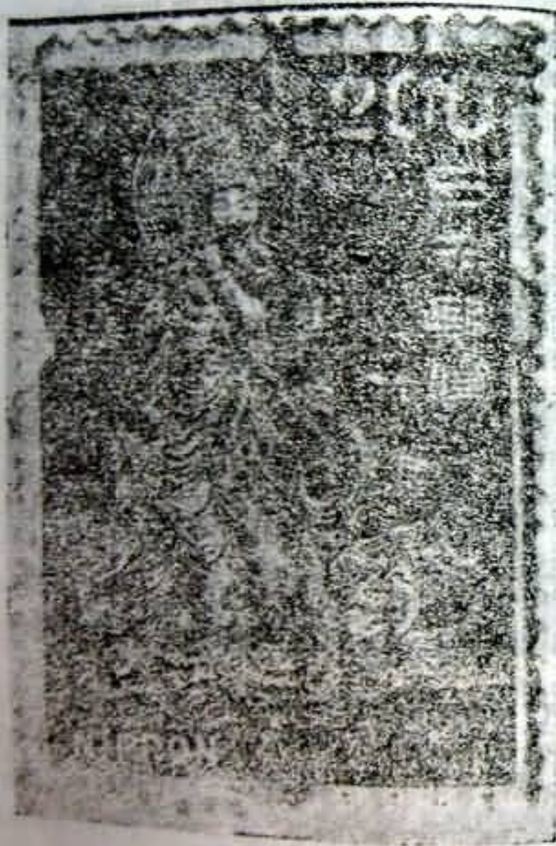
जापानी डाक टिकट का यह एक बड़ा चित्र है। इसमें भगवान कृष्ण मुरली बजाते दिखाए गए हैं।

में अभी तक भगवान कृष्ण की स्मृति अनजाने टिकी हुई है। यदि ऐसा न होता तो डाक कार्यालय के चित्रकार ने सिर पर मोरपंख लगाए, आड़ी बांसुरी बजाने वाले कृष्ण का चित्र न निकाला होता। विशेषतः तब जब किसी जीव की प्रतिमा इस्लामी प्रथा में वज्रित है। उस चित्रकार के संग्रह में वैदिक परम्परा के ऐसे और भी दैवी चित्र अवश्य होंगे, विद्वानों को शोध करने की आवश्यकता है।