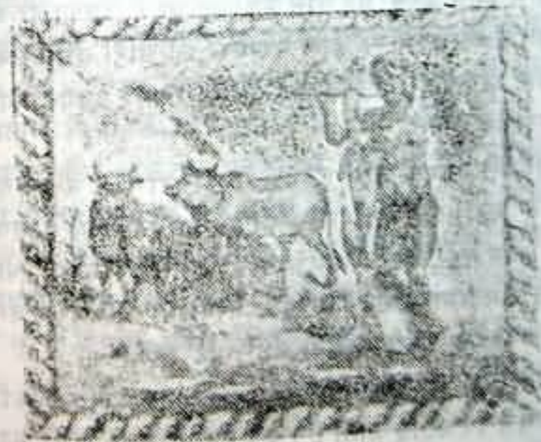
ऊपर का चित्र ग्रीस देश के कॉरिथ नगर के म्यूजियम में प्रदर्शित है।

शोध करने पर सारे देशों के प्राचीन साहित्य में और दन्तकथाओं में भगवद्गीता, कृष्ण चरित्र, महाभारत, रामायण, हनुमान की कथाएँ, वेदोपनिषद् आदि के अस्तित्व के प्रमाण अवश्य मिलेंगे। अभाव केवल संशोधन का है। इस्लामी, ईसाई, यहूदी या कम्युनिस्ट विचारधारा से प्रभावित व्यक्ति निजी संकुचित दृष्टि त्यागकर यदि कृस्तपूर्व काल के इतिहास का निष्पक्षता से अध्ययन करें तो उन्हें अवश्य वह सारा दवाया गया इतिहास प्राप्त होगा।