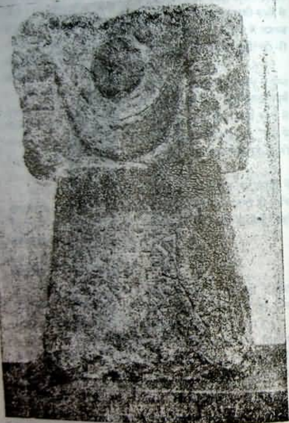
इस्लामपूर्व अवंस्थान में पाई यह शिला ब्रिटिश म्यूजियम, लण्डन में प्रदर्शित है। इसके ऊपरी भाग में सूर्य गोल और चन्द्रकोर खुदा है। निचले

यह चिह्न अवंस्थान में पाया जाना सिद्ध करता है कि अवंस्थान में वैदिक, वैष्णव संस्कृति थी। मंदिरों पर यह चिह्न ऐसा दिग्दर्शित करता है कि सूर्य, चन्द्र आदि को तेज, प्रकाश, ऊष्मा आदि भगवान द्वारा ही प्राप्त होते हैं।